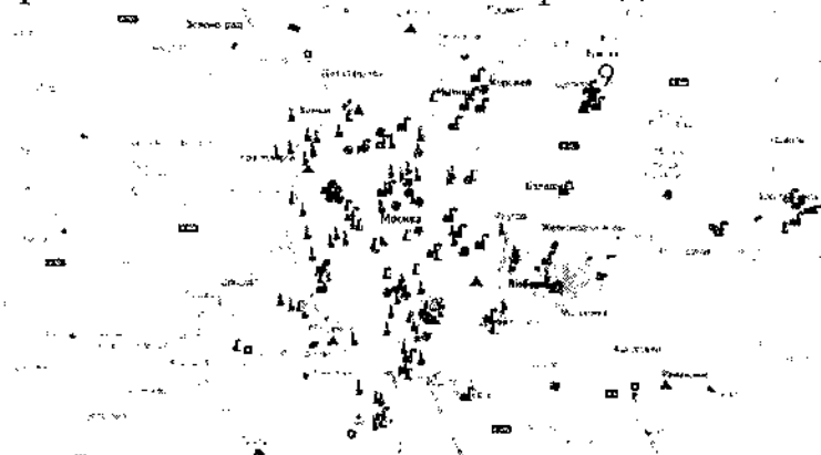
Рисунок 1 - Схема метрополитена

5. Рисунки оформляются в соответствии с приведенным ниже примером: