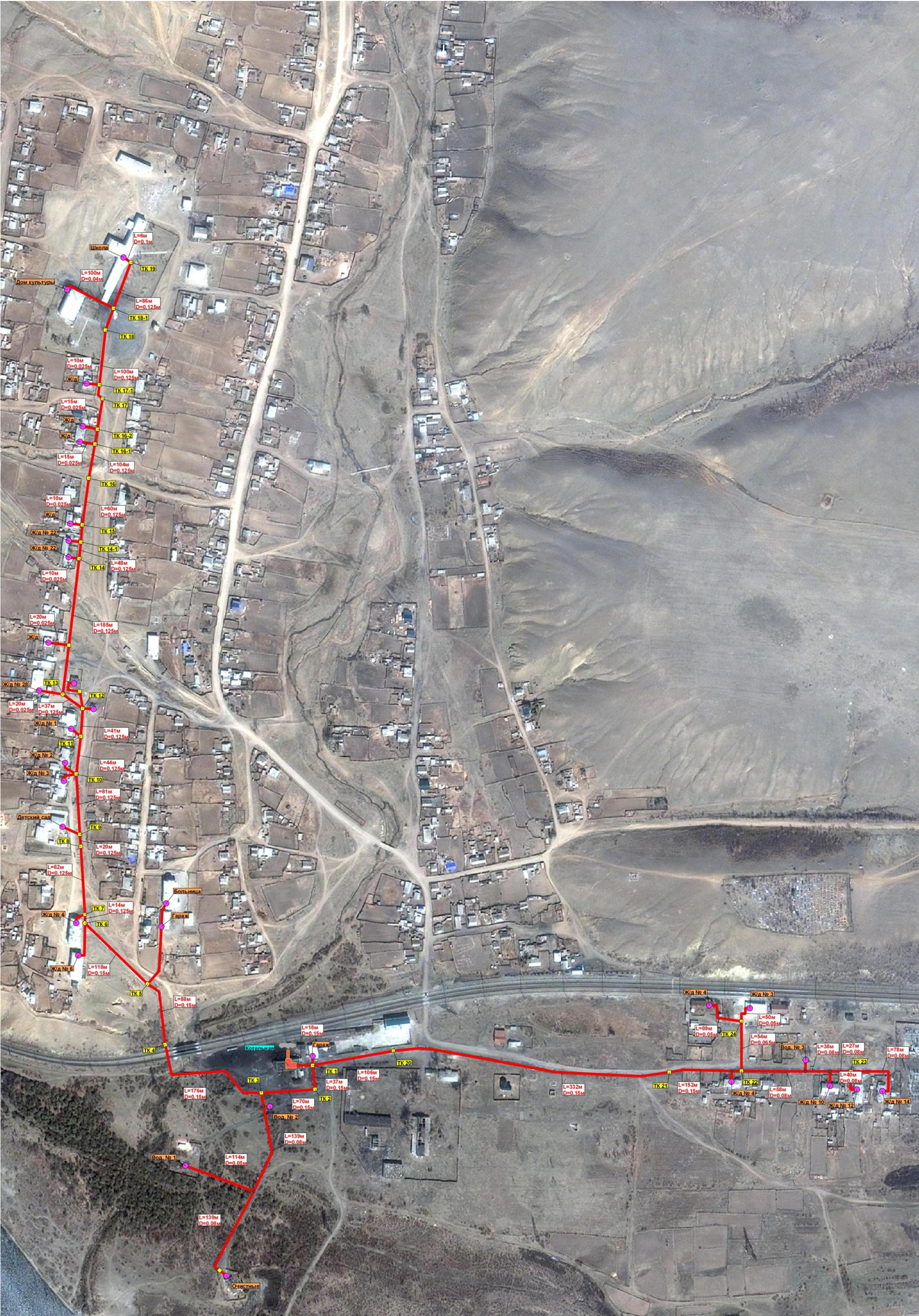
Рис. 2.2 – Схема теплоснабжения села Размахнино.