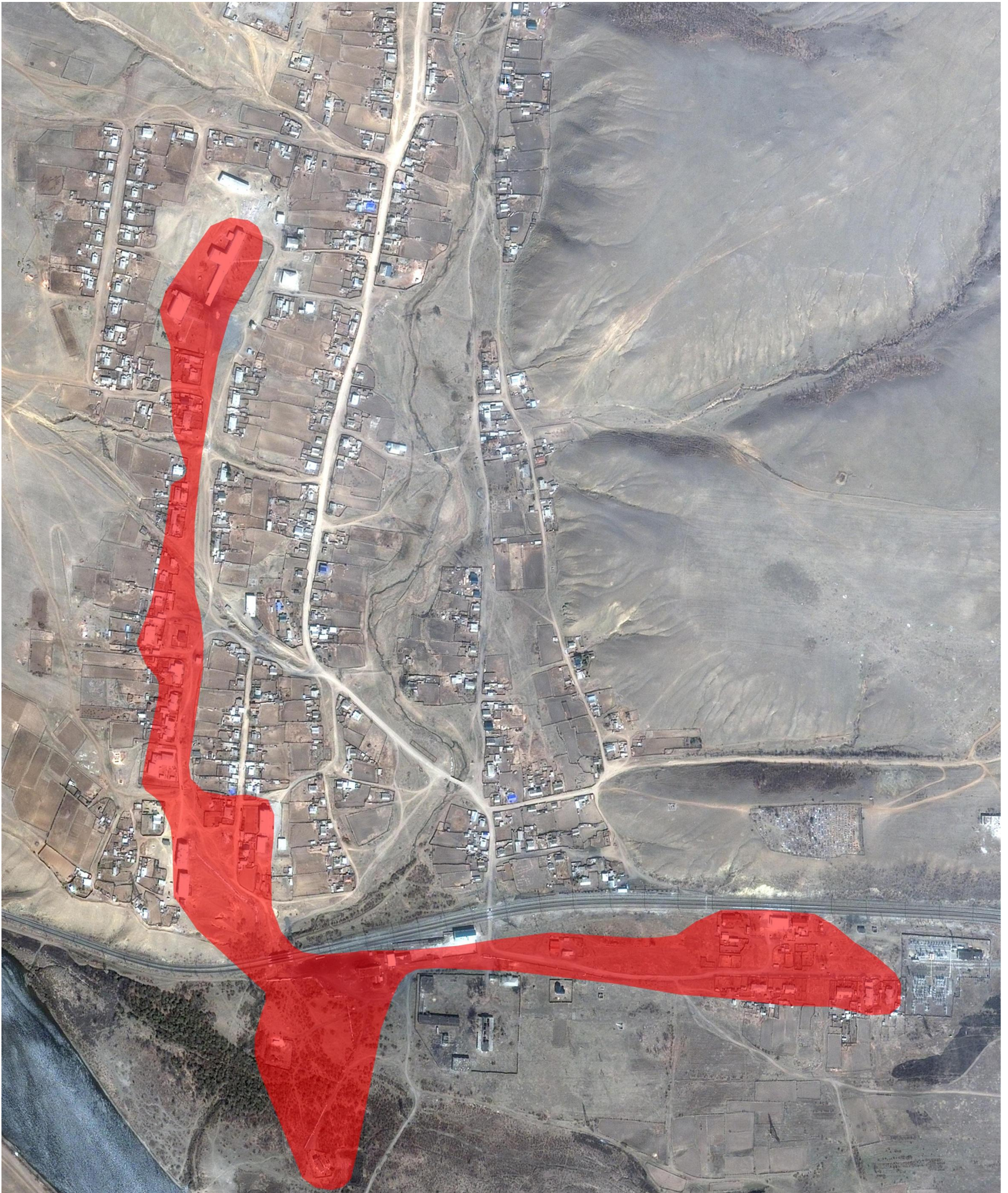
Рис. 2.1 – Зона действия теплоснабжения сельского поселения "Размахнинское".